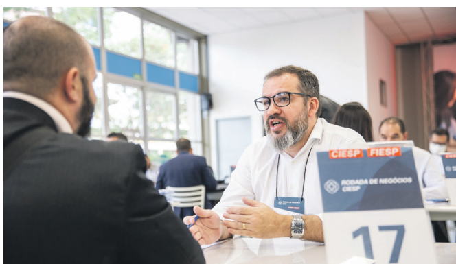
Danilo Bertoni - Flexform